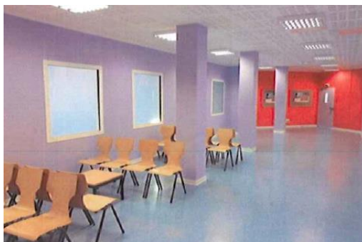
Salle d'attente des familles